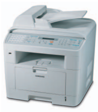
Samsung SCX-4720F Multifunktionsgerät