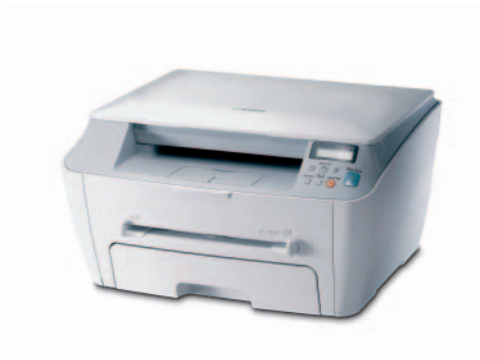
Samsung SCX-4100 Multifunktionsgerät