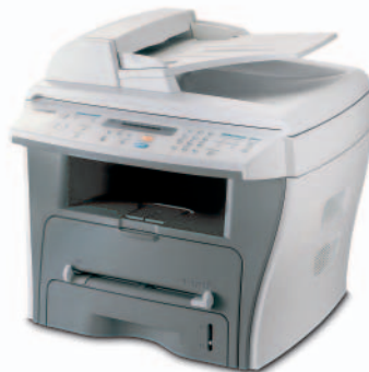
Samsung SCX-4216F Multifunktionsgerät