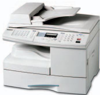
Samsung SCX-5315F Multifunktionsgerät