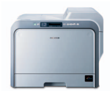
Samsung CLP-550/550N Farblaserdrucker