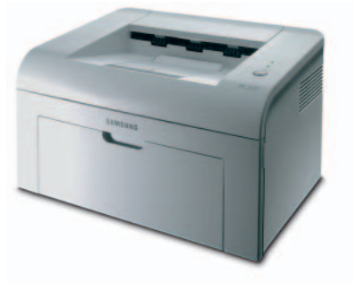
Samsung ML-1610 Monochromer Laserdrucker