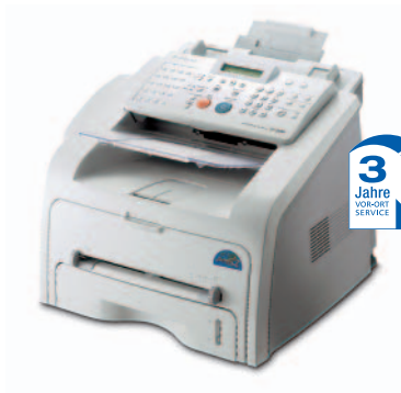
Samsung SF-560/565P Laser-Faxgerät