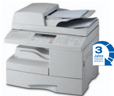
Samsung SCX-6320F Multifunktionsgerät