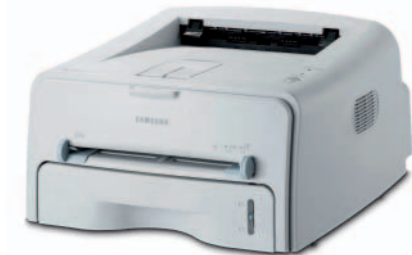
Samsung ML-1520 Monochromer Laserdrucker