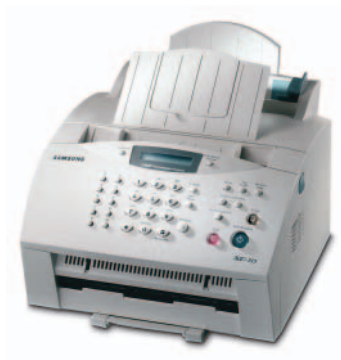
Samsung SF-515 Laser-Faxgerät