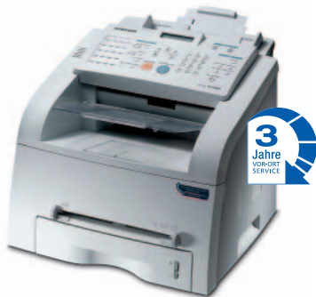
Samsung SF-750/755P Laser-Faxgerät