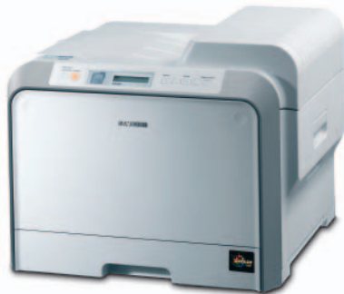
Samsung CLP-510/510N Farblaserdrucker