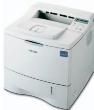
Samsung ML-2150 Monochromer Laserdrucker