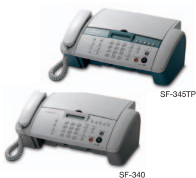
Samsung SF-340/345TP Tintenstrahl-Faxgerät