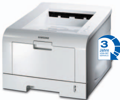
Samsung ML-2250/2251N Monochromer Laserdrucker